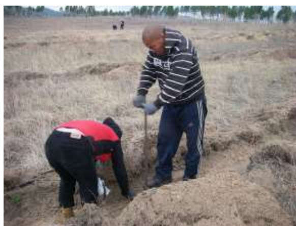
写真4. 植林時の状況