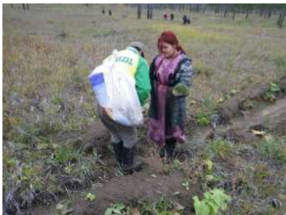
写真 6. 植林時の状況