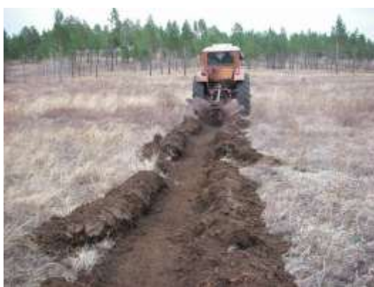
植林前の溝掘り状況 (2013年5月12日撮影)