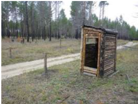
山火事危険期に使用する関所 (2013年9月22日撮影)