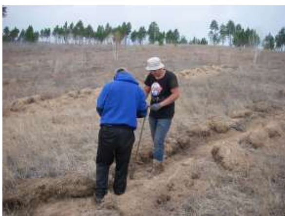
写真3. 植林時の状況