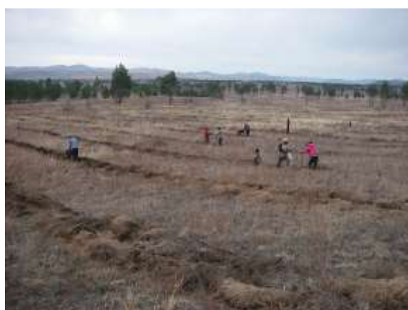
写真2. 植林時の状況