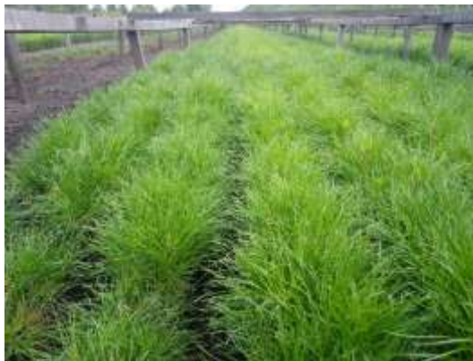
苗木の状況 (2012年8月撮影)