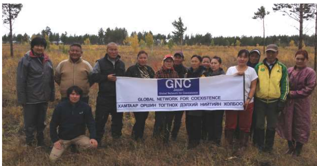
写真 10. 秋季植林時の集合写真