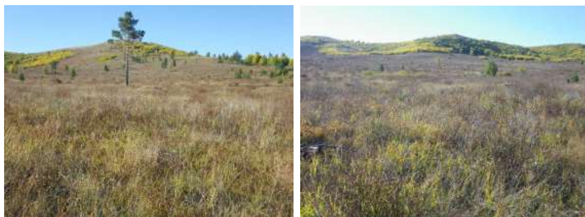
2014 年植林予定地写真

2014 年も例年通り植林を実施する。場所はアルタンボラグ村に位置しトジーンナルス南西方向のイッヒゲルチョロート山の麓である。2014 年と 2015 年の植林はこの場所で植林を実施する予定である。