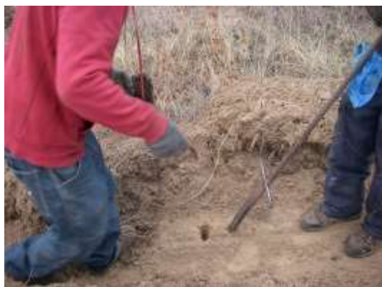
植林時の状況 (2013年5月13日撮影)