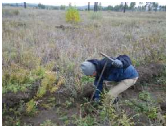
写真 9. 植林時の状況