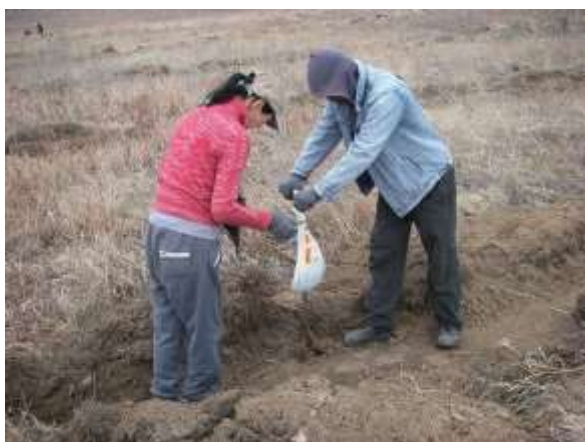
写真1. 植林時の状況