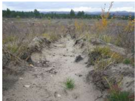
春季植林の活着状況 (2013年9月22日撮影)