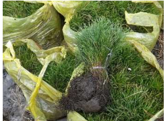
苗の仮保存状況 (2013年9月22日撮影)

また、植林地全体の変遷と苗木の成長を把握を把握するため、定点観測調査と毎木成長量調査を行った。今後数年毎にモニタリング調査を実施し、植林地としての変化を追いかけることとする。