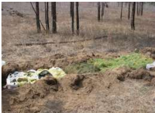
苗の仮保存状況 (2013年5月12日撮影)