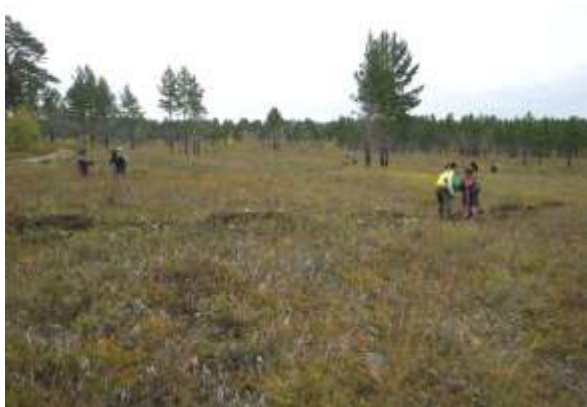
写真 8. 植林時の状況