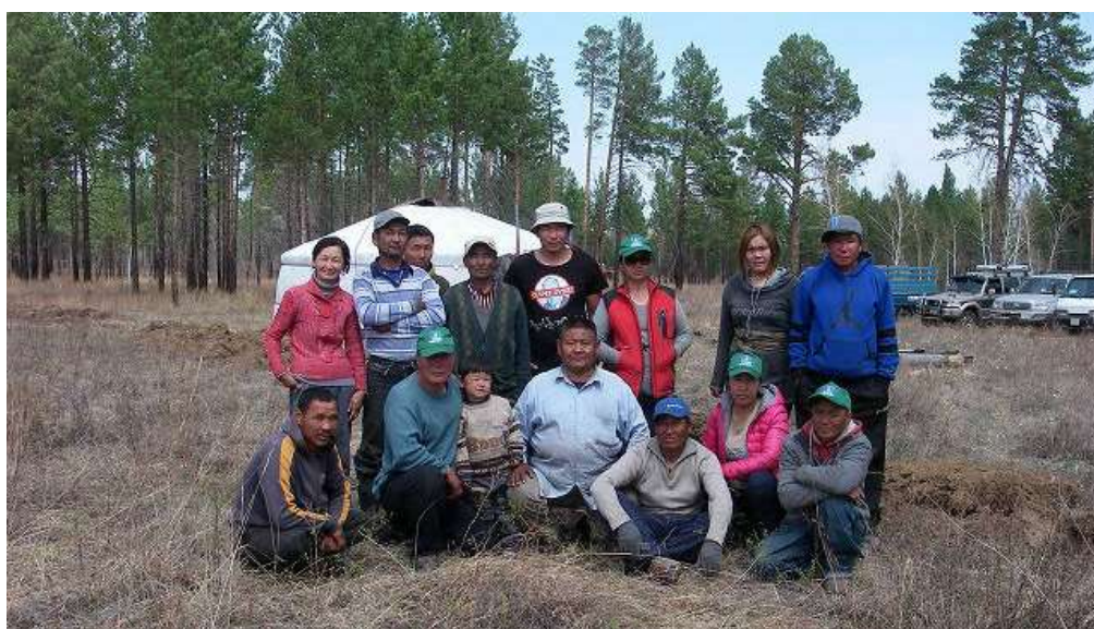
写真5. 春季植林時の集合写真