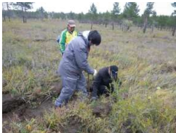
写真 7. 植林時の状況