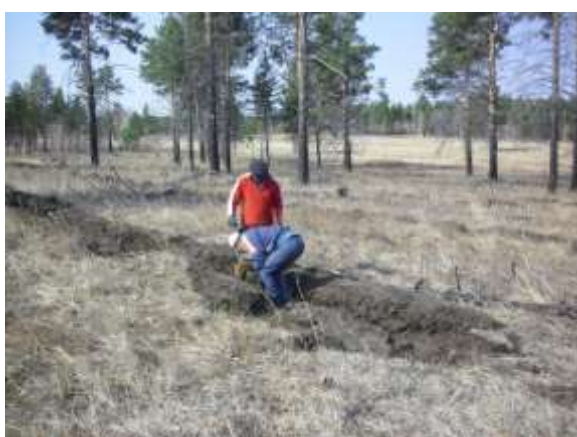
写真 3. 植林時の状況