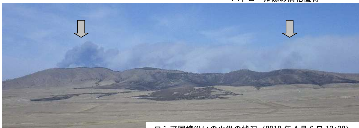
ロシア国境沿いの火災の状況 (2012年4月6日 13:32)