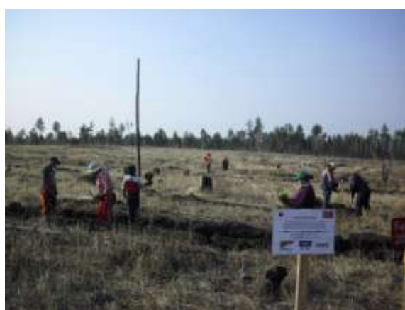
写真 4. 植林時の状況