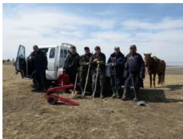
丘の上で常時見張るパトロール隊