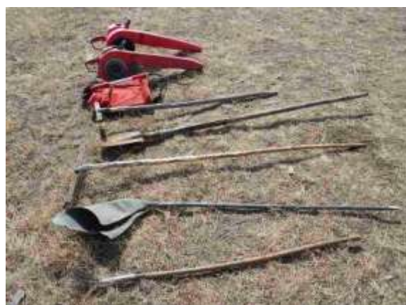
パトロール隊の消化機材