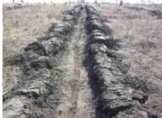
植林時の状況 (2012年5月9日撮影)