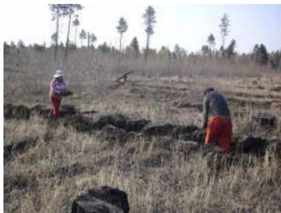
写真 2. 植林時の状況