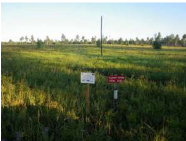
夏季の状況 (2012年8月24日撮影)

8月の時点で、苗木の活着は不良な箇所が確認されたため、9月下旬にこれらの箇所について再植林を行った。