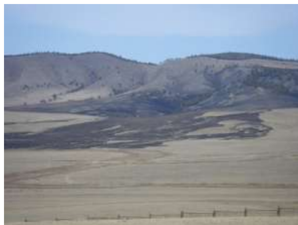
3月22日にロシアから越境してきた火災跡

このため、GNCは森林火災対策としてセレンゲ県森林局やアルタンボラグ村、地域住民、国境警備隊などが横のつながりをもって林野火災に対処できるように、今後とも各関係機関と協議を重ね火災による延焼を最小限に抑えるよう現場にて調整役を務める。