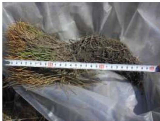
植林に用いた苗 (2012年5月9日撮影)

植林地では家畜の放牧は全く行われておらず、住民も居住していない。土壌は砂壤土で黒色、植生はイネ科やキク科の下層植生が密生、草丈の長いものは秋に1m程に達しているものも見られる。10年程前は林地であったが、その後の天然更新がうまくいっておらず、植林による木本植生被覆が望まれる。右に植林時の状況写真を示す。