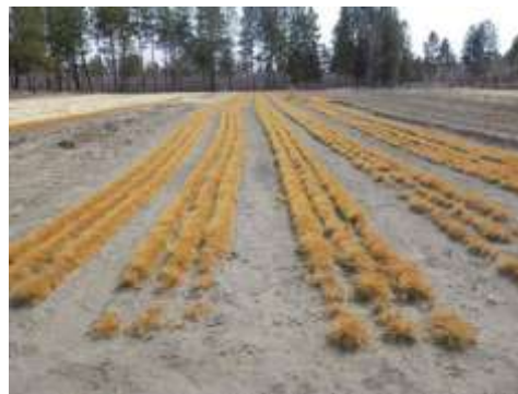
無積雪のため乾燥し多くの苗が黄色く枯れ上がる苗畑の状況 (2012年4月5日撮影)

葉は黄色く枯れた色であったが、梢端部の芽は生きている苗が確認できたため、これらを植林することとした。植林前に多くの苗がこの無積雪により被害を受けたため、2012年の植林は予定本数を大幅に下回ることとなった。