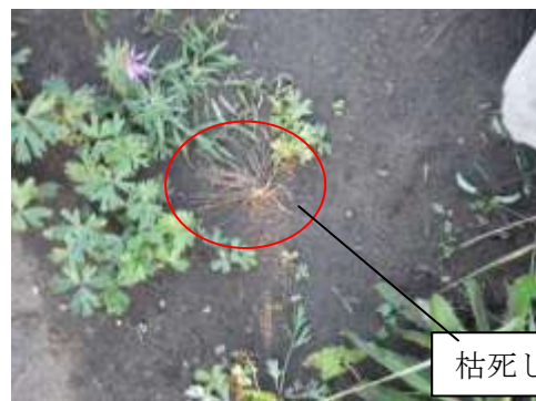
夏季の状況 (2012年8月24日撮影)