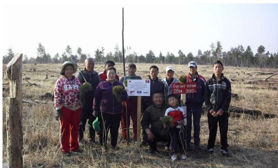
写真 3. 植林作業を手伝っていただいた方々の集合写真