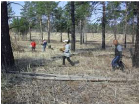
写真 1. 植林時の状況